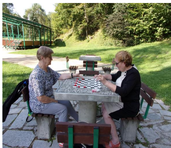
Nasze „ustrzyckie klimaty”