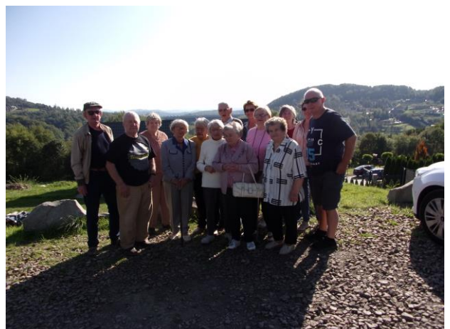
Kolejna wycieczka zorganizowana została w październiku 2020 r, gdzie seniorzy zwiedzili Cerkiew grekokatolicką w Równi, Browar Ursa Maior w Uhercach Mineralnych, Zwierzyń i Cudowne Źródélko, następnie Centrum Kultury Ekumenicznej im. Św. Jana Pawła II, Park Miniatur Sakralnych, Ogród Biblijny.