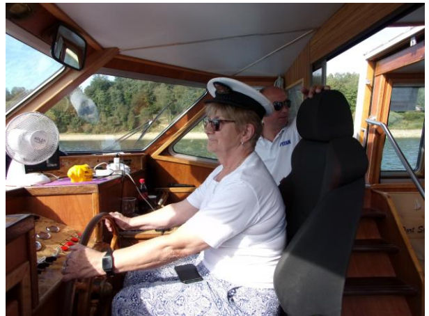
Wycieczka po „Zaporze Solińskiej” największej budowli hydrotechnicznej w Polsce po i pięknej okolicy