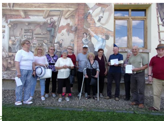
go Ośrodka P