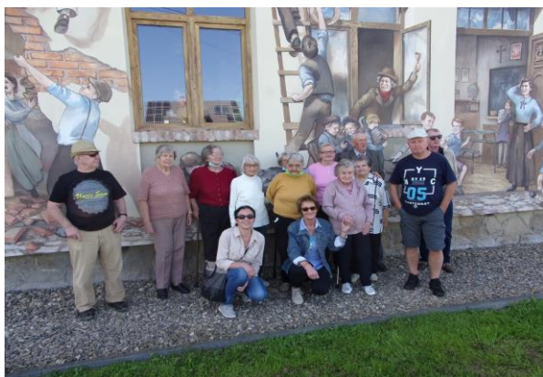
Za rok 2020

Wycieczka odbyła się w reżymie sanitarnym.